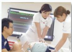
高機能 シミュレーション研修