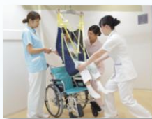
基礎的介護技術研修