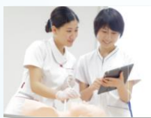
iPadによる 看護技術手順確認