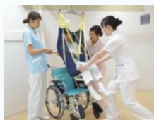
基礎的介護技術研修