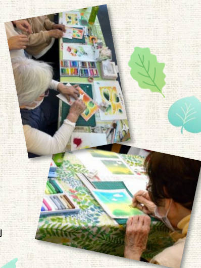
「認知症カフェ」のバステルアート教室

Jiman 1 働きやすい環境 子供たちを安心して預けられる院内保育園があり 多くのママさんスタッフが活躍しています。 また、親の介護をしながらでも働ける環境でもあります。